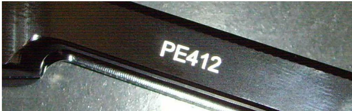
Art der Kennzeichnung